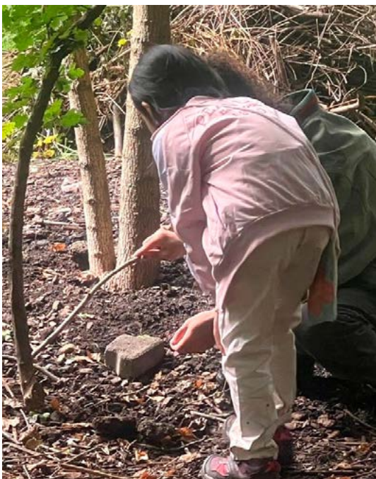
In der Natur Ameisen beobachten: für Kinder eine willkommene Abwechslung zum Alltag im Asylzentrum

Dank des engagierten Einsatzes unseres Koordinators und von freiwilligen Mitarbeiterinnen waren die Nachmittage ein voller Erfolg. Für die Kinder stellen diese Anlässe eine wertvolle Gelegenheit dar, unbeschwert Zeit zu verbringen, sich zu bewegen und gemeinsam Spass zu haben.