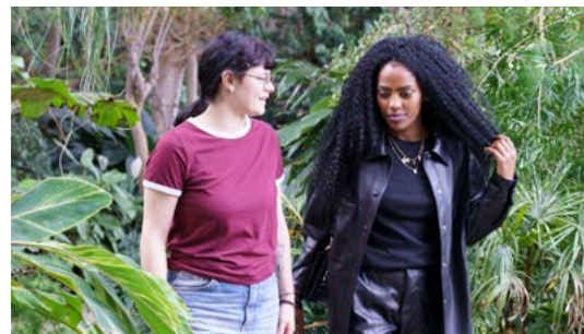
Tandems sind eine gegenseitige Bereicherung

Diese Angebote stärkten die Identifikation mit dem Programm und den Austausch untereinander sowie mit dem Team. Auch für das Jahr 2026 sind solche Anlässe geplant. Das vom Kanton finanzierte Programm ist mindestens bis 2027 gesichert.