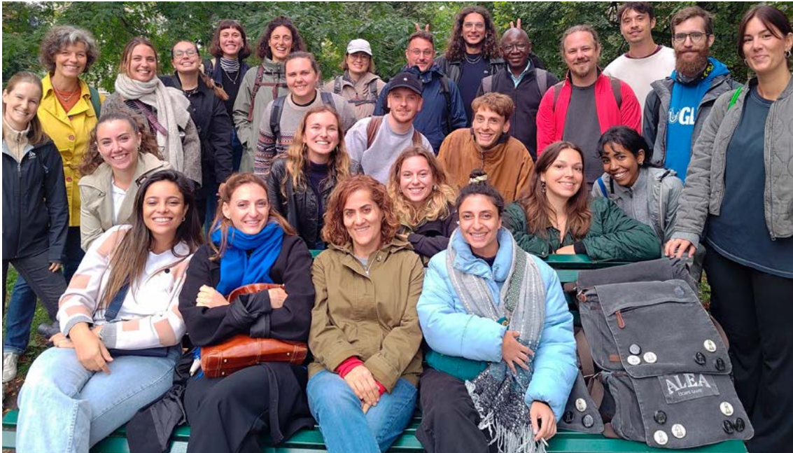
Teamkultur pflegen: Jahresausflug des Bereichs Asyl und Integration in Genf