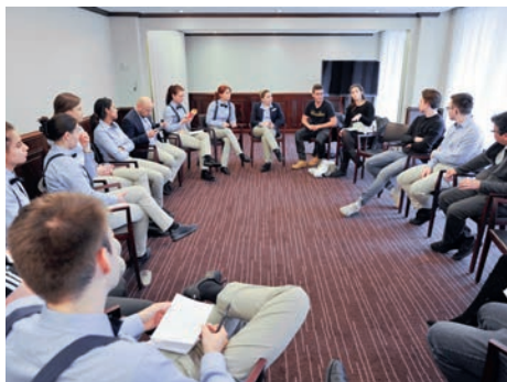
Lors des rencontres Likrat Public, il n'y a pas de mauvaises questions. Les collaborateurs d'un hôtel zurichois approfondissent leurs connaissances sur le judaïsme et sur les juifs.

La commémoration de la Shoah était un thème significatif pour la FSCI en 2017. Cette année, la Suisse a assumé la présidence de l'IHRA (International Holocaust Remembrance Alliance). Pendant cette année présidentielle, la FSCI a renforcé sa coopération avec l'IHRA. Nous avons participé à l'élaboration d'un numéro du magazine « Tan-