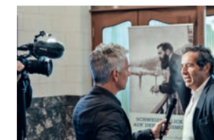
Animateur de la table ronde des journalistes : Roger Schawinski, journaliste et entrepreneur médiatique.