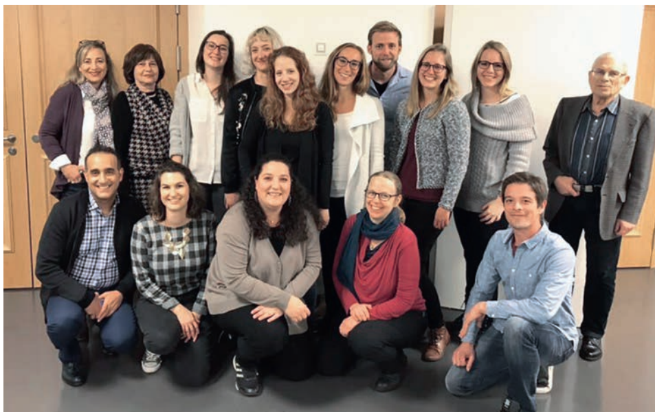
L'équipe du VSJF