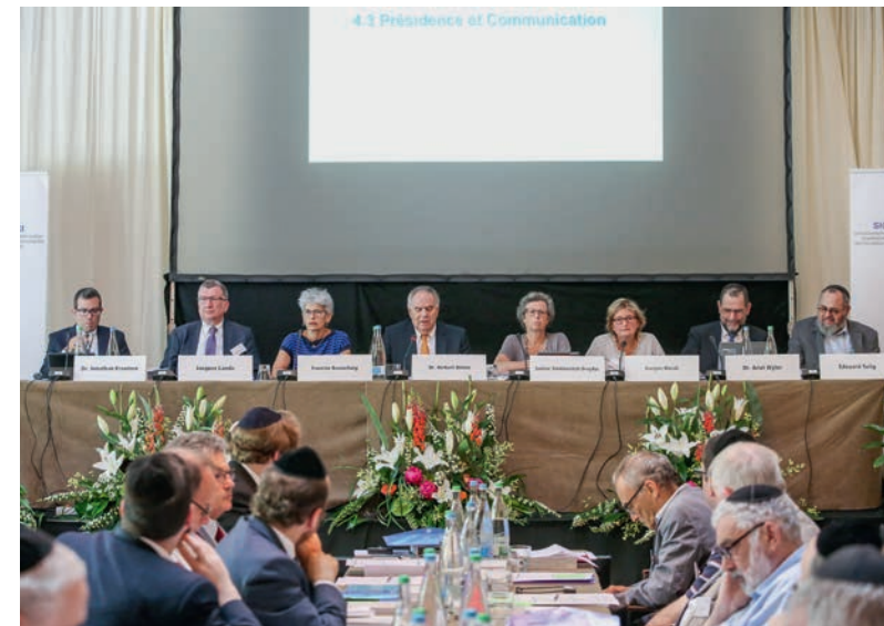
Le Comité directeur de la FSCI à l'Assemblée des délégués 2017. Thème central : la sécurité.

Des inconnus ont affiché des transparents bien visibles sur l'autoroute A3. Une affiche accrochée à un pont appelait au meurtre : « Tuer les juifs », une deuxième portait une croix gammée, une troisième présentait l'inscription « I love Hitler ». La FSCI a porté plainte contre inconnu.