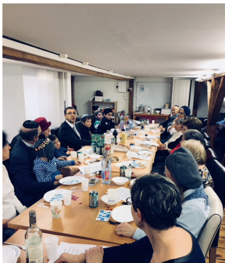
Fête de hanoukka commune du foyer des séniors et du foyer russophone

En 2017, les préparatifs pour la restructuration du système d'asile en Suisse, prévue pour 2019, ont bien avancé. Avec les autres œuvres d'entraide affiliées à l'Organisation suisse d'aide aux réfugiés (OSAR), le VSJF s'engage activement pour une mise en œuvre équitable du nouveau système. Il participe aux procé-