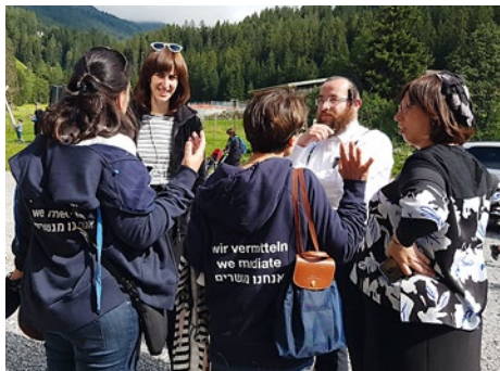
En dialogue avec des voyageurs juifs, deux Likratins en profitent pour faire passer leurs messages et instaurer une bonne entente entre eux et les habitants de la région.