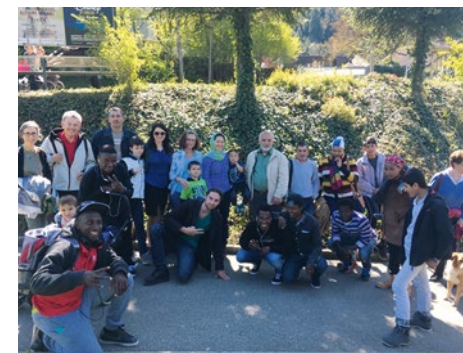
Excursion «better together» au parc animalier Langenberg

L'équipe conseil du VSJF met les requérants en communication avec les autres parties prenantes à la procédure et les conseille en matière juridique et sociale. Tous les requérants sont invités à un premier entretien de conseil et ont ainsi la possibilité de s'adresser à tout moment à une instance facilement accessible.