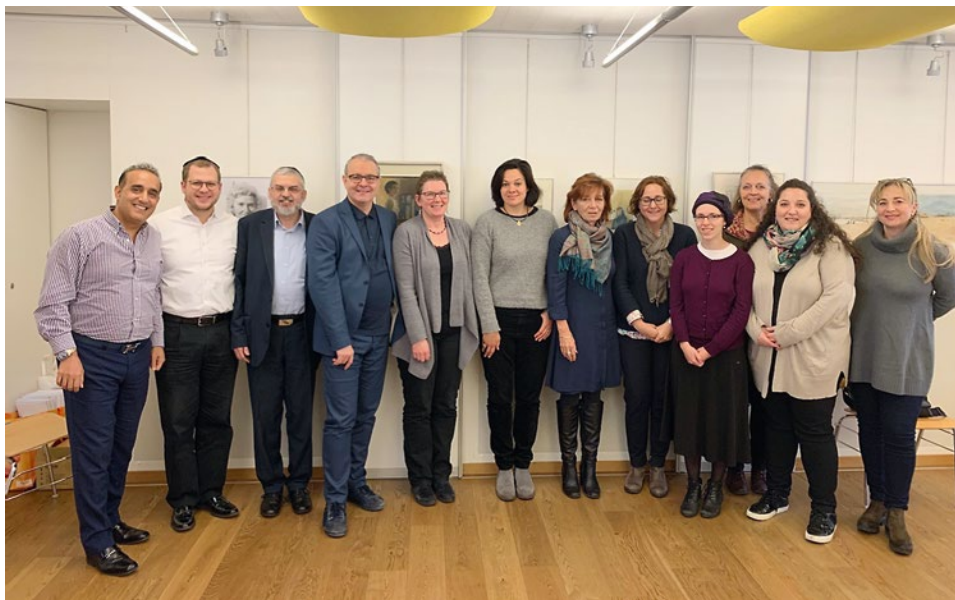
Participants à la formation continue donnée à Berne