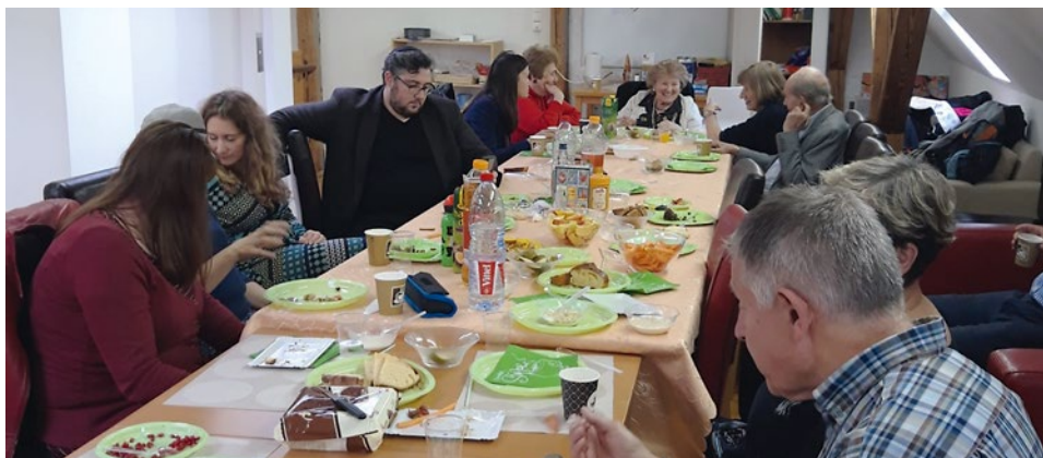
Le foyer russophone