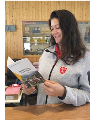
La collaboratrice de l'office du tourisme de Saas-Grund plongée dans la lecture de la brochure d'information « L'accueil des voyageurs juifs en Suisse ».