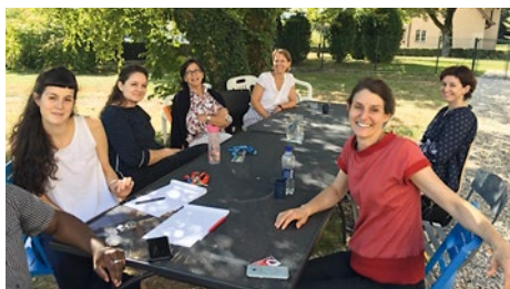
Le comité du VSJF en visite au centre fédéral pour requérants d'asile de Boudry (NE)

une protection juridique gratuite, constituée d'un conseil et d'une représentation juridique. Ces changements ont conduit le VSJF à mettre fin en 2019 à deux mandats et à développer ses activités de conseil en Suisse romande.