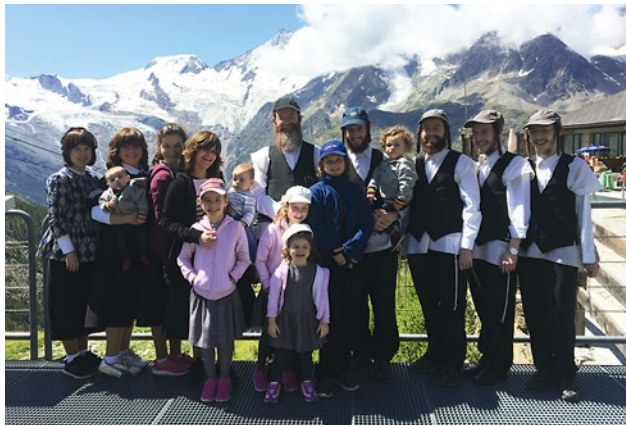
La brochure de la FSCI, destinée aux voyageurs, leur explique les particularités et les usages de la Suisse et de ses habitants.

Les photos montrent les médiatrices et médiateurs de Likrat Public en plein travail. Leur engagement ainsi que les brochures d'information ont fortement contribué à rapprocher les voyageurs juifs des habitants d'Arosa, de Davos et de la vallée de Saas et à instaurer entre eux des rapports de confiance.