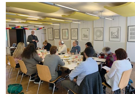
Colloque Droit du travail