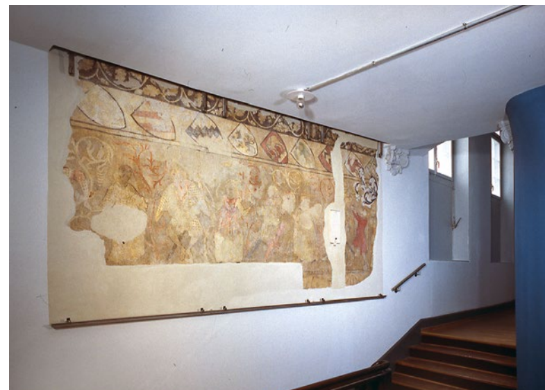
Les peintures murales de la maison de la Brunnigasse 8 figurent aujourd'hui parmi les classiques de l'histoire culturelle des juifs d'Europe.

En septembre 2019, le Conseil des États a adopté sans discussion le postulat «Définition de l'antisémitisme de l'International Holocaust Remembrance Alliance» (IHRA), lequel charge le Conseil fédéral de produire un rapport sur l'opportunité d'utiliser la définition de l'antisémitisme de l'IHRA dans la politique de la Confédération. Ce rapport étudiera les conséquences juridiques que cette définition implique pour la politique intérieure et extérieure de la Suisse. Il expliquera en quoi elle sera utile au travail de sensibilisation, de prévention, de conseil et d'intervention que mènent la Confédération, les cantons et les communes, il en montrera l'utilité pour la col-