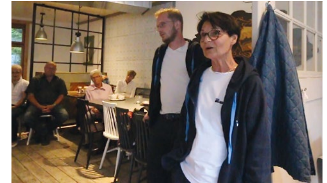
Les Davosiennes et Davosiens ont eu la possibilité de poser personnellement aux Likratins et Likratinos leurs questions concernant la vie juive.