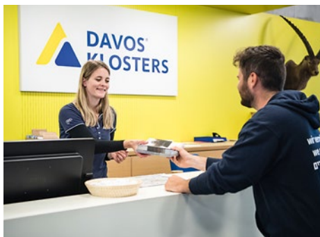
Un Likratino distribue à Davos des exemplaires de la brochure «L'accueil des hôtes juifs en Suisse», véritable mine d'informations sur la culture, la tradition et la religion juives ainsi que sur la diversité de la vie juive.

Opiniâtre, d'une grande ténacité, la FSCI a remporté sur le terrain de la sécurité des succès qui comptent et ce, au niveau de la Confédération. On retiendra parmi ceux-ci l'entrée en vigueur, le 1 er novembre 2019, de l'«Ordonnance sur les mesures visant à garantir la sécurité des minorités ayant un besoin de protection particulier» – un premier pas important sur le chemin du renforcement de la sécurité et de l'allègement du fardeau financier que supportent les institutions et les communautés juives. Dorénavant pourront être soutenus des projets portant sur la sécurité des bâtiments, sur la formation, la sensibilisation et l'information. La Confédération prévoit à cet effet une aide de l'ordre de 500 000 francs par année. Les mesures définies par l'ordonnance ont pour base un concept de protection élaboré par un groupe de travail constitué de représentantes et de représentants de la Confédération, des cantons et des villes ainsi que des minorités concernées et de la FSCI.