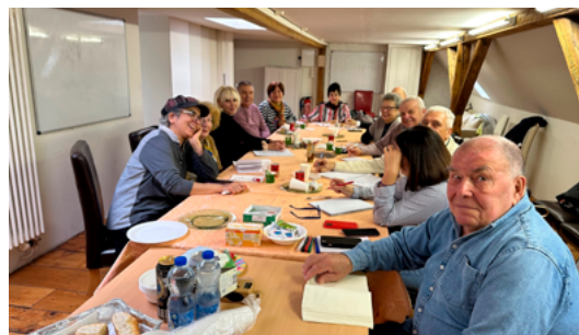
Participants et participantes à la rencontre ukrainienne