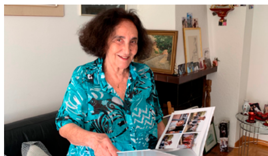
De l'espace pour les souvenirs

De nouvelles négociations entre l'État allemand et la Claims Conference ont permis de dégager des moyens financiers supplémentaires. Grâce au programme Home Care, les personnes suivies ont la possibilité de passer les dernières années de leur vie dans un environnement familial.