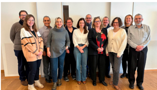
Les collaborateurs et collaboratrices des services des affaires sociales des communautés juives

Cette formation continue s'adressait aux spécialistes du domaine social des institutions juives de toute la Suisse. Elle a également suscité l'intérêt de conseillers et conseillères qui s'occupent de personnes âgées ou en situation de handicap.