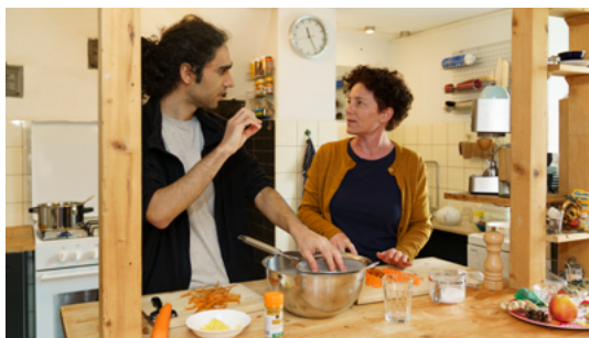
Cuisiner ensemble - un tandem prépare le déjeuner.